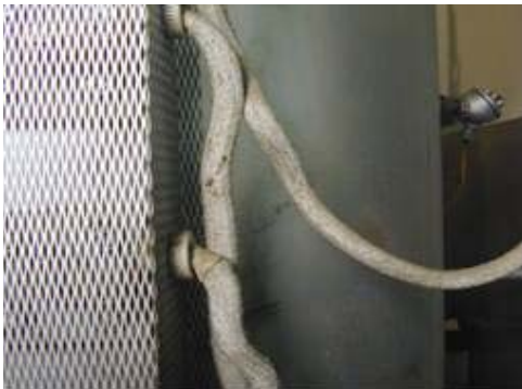
Aislante térmico textil en horno