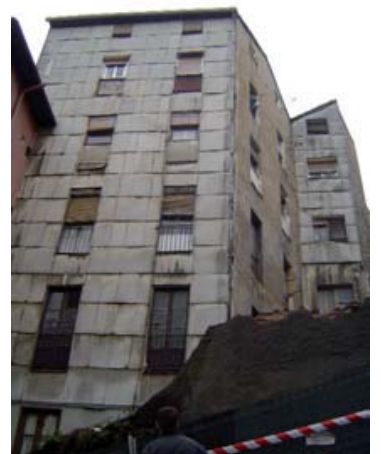
Paramentos de fachadas