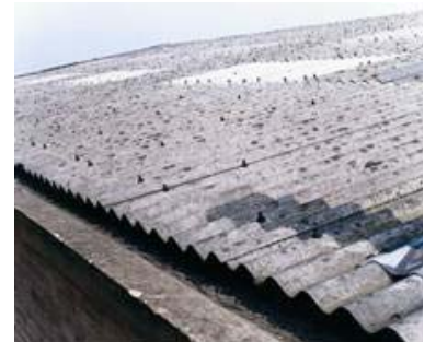
Planchas onduladas en techo