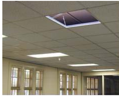
Placas de falso techo acústico