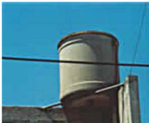
Tanque de agua de fibrocemento