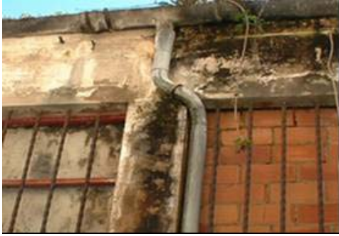
Canalón y bajante de recogida de aguas