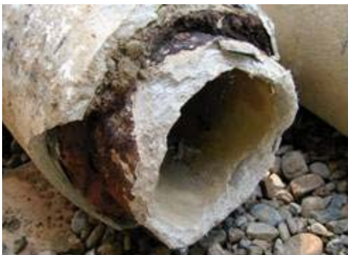
Tubería de fibrocemento