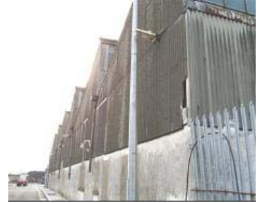
Revestimiento externo de fibrocemento