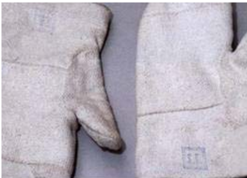
Guantes de laboratorio